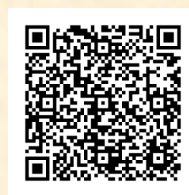
Порядок действий при нахождении на работе