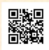
Официальный сайт ГУ МЧС России